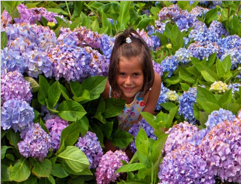
Plano de expressão